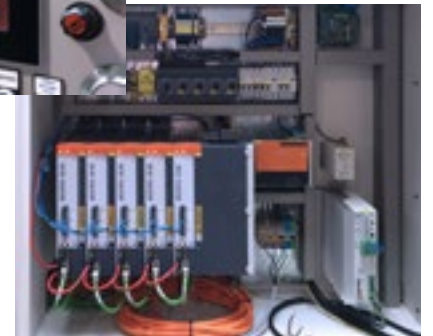
Modernisiertes Human-Machine-Interface und neueste Elektronik